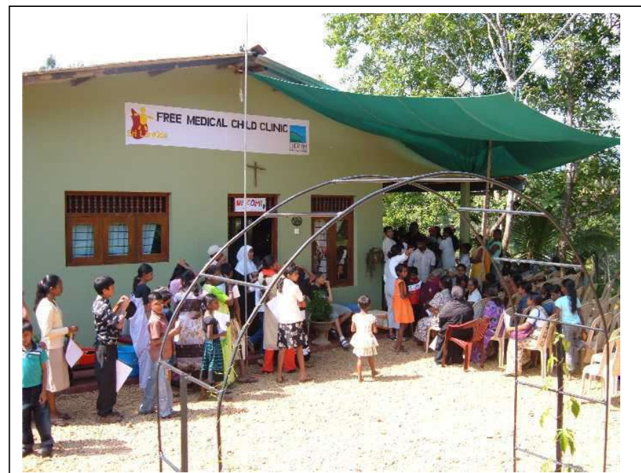
2009: Medische check-up in het kindertehuis van Cherith, voor alle Sri Lankids.