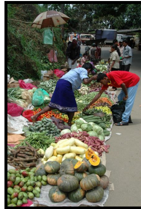
foto: markt in Nawalapitiya

Op dit moment steunt Sri LanKids maar liefst 52 kinderen. Als we bedenken dat we een aantal jaren geleden met 20 kinderen startten, kunnen we spreken van een grote vooruitgang! En dat alles natuurlijk dankzij jullie steun!!